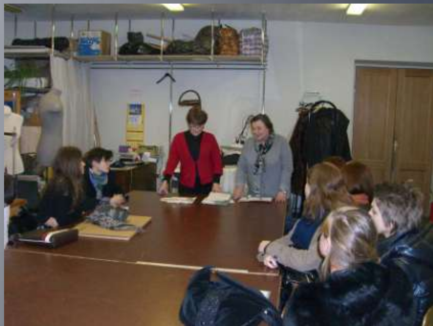
Подведение итогов конкурса